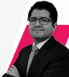
JHUSJEIN FORT NINAMANCCO CORDOVA